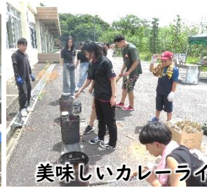
美味しいカレーライスができました♡