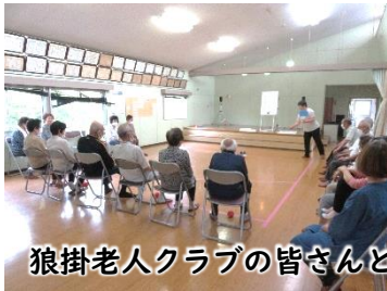
狼掛老人クラブの皆さんとポッチャを行いました♪