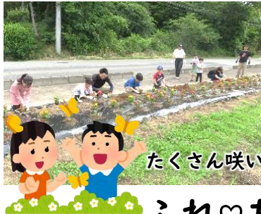
たくさん咲いてね!!