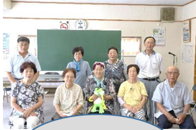
畑岡老人クラブの皆さんと