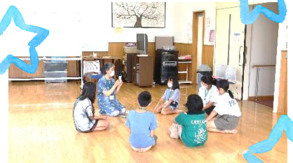
英語でゲーム☆楽しいね!