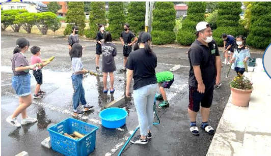
楽しい夏の体験教室!!